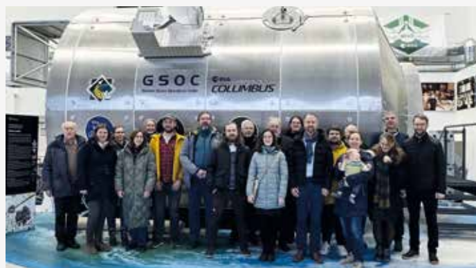
Das Columbus-Modul gab es bei Besuch des DLR vom Bezirk Bayern-Süd zu entdecken S. 165