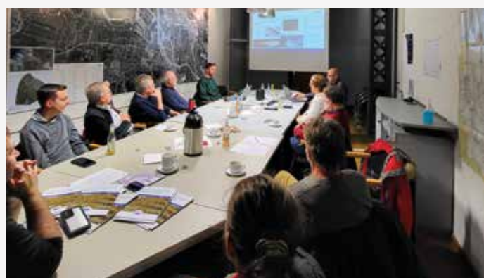
Nautische Tiefen waren Thema beim Besuch der HPA des LV HH/SH S. 166