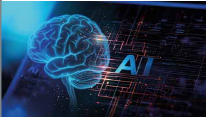
Künstliche Intelligenz, quo vadis? S. 120