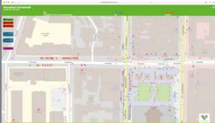
Parkraummanagement: Anwendung S. 114