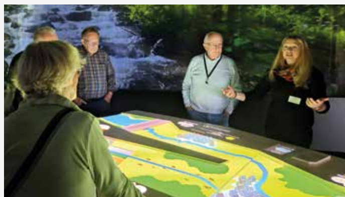
Der Bezirk Bielefeld besuchte die KlimaErlebnisWelt in Oerlinghausen S. 169

Redaktionsschluss für redaktionelle Beiträge für die Ausgabe 3/2025: 20. April 2025