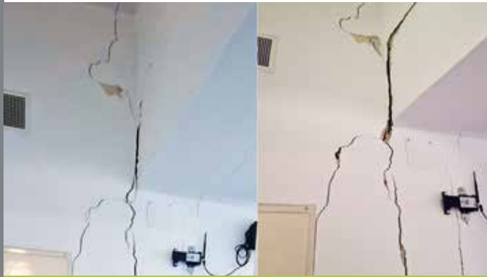
Rissüberwachung durch Sensoren S. 112