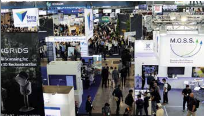
Endlich wieder INTERGEO! 2024 in Stuttgart