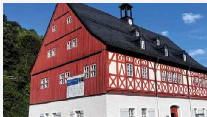
17. VDV-Landesverbandstag des Freistaat Sachsen in Döbeln S. 566

Redaktionsschluss für redaktionelle Beiträge für die Ausgabe 1/2025: 20. Monat 2024