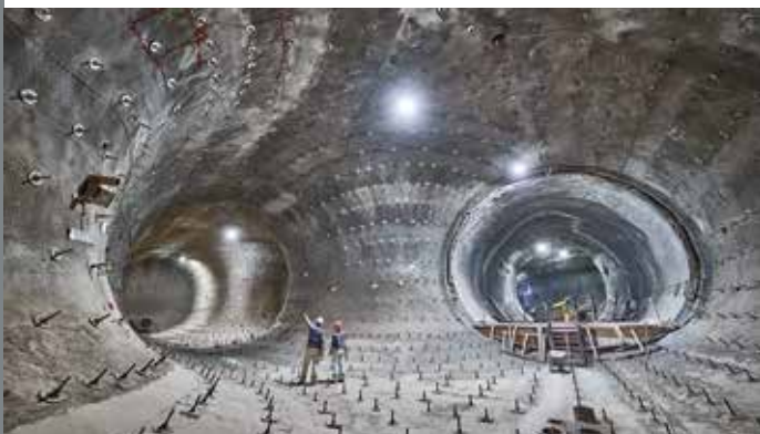
Ausbau in der Schachanlage Konrad mit Anker