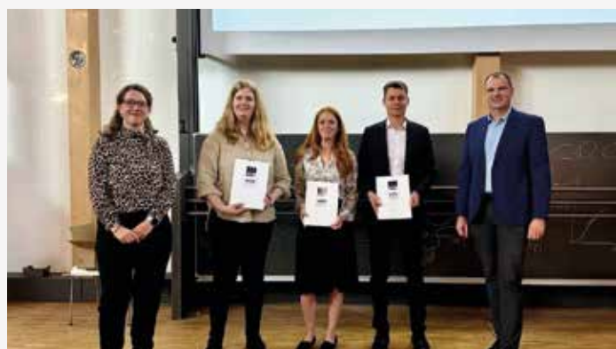
Ehrung der Jahrgangsbesten an der Hochschule Bochum S. 559