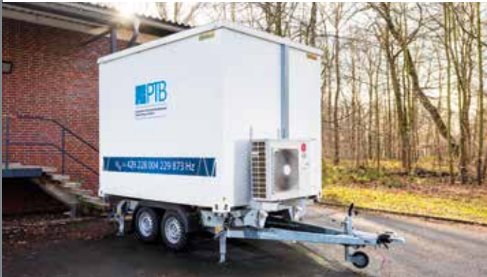
Transportable Strontium-Gitteruhr der PTB